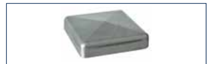
An den Torpfosten kommen jetzt Alu-Kappen zum Einsatz