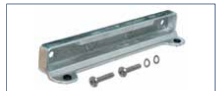
Der passgenaue Anschlag sorgt für höchste Schließgenauigkeit