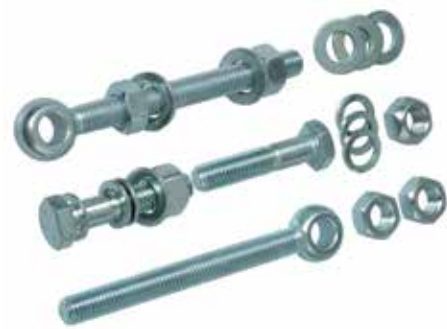
Sehr stabile Torbänder mit Augenschrauben werden das Multi-Tor auf