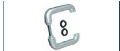
Die neue hochwertige Alu-Drückergarnitur passt optisch perfekt zum Multi-Tor