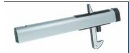
Der Torflügelsteller* für das Multi-Tor stammt vom Industrie-Tor