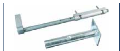
Auch Bodenriegel und -hülse* werden jetzt in Industrie-Qualität geliefert